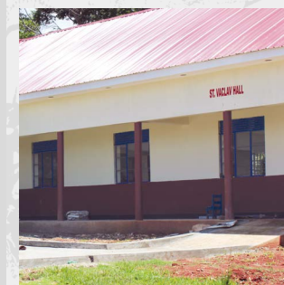
Bloky internátu nesou jména českých světců.

Samotná stavba internátu proběhla v době koronavirové uzávěry škol v letech 2021–2022. Jejich náklady činily 1,7 milionů korun. Tři bloky nesou jména ugandských a českých světců: sv. Ludmily, sv. Václava a sv. Cyriana. Čtvrtý blok byl vložen pod ochranu Matky Terezy, která zasvětila svůj život pomoci chudým a trpícím. ○